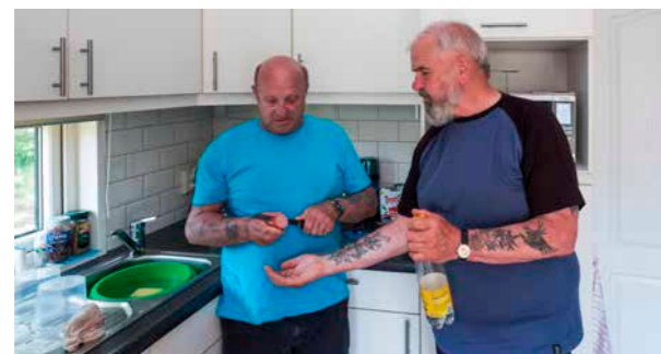
Even lunchen in het huisje en daarna snel terug naar de waterkant om weer te gaan vissen.